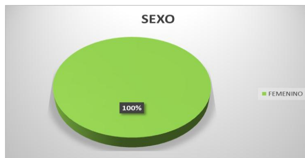
Figura 1 Sexo de estudiantes de Enfermería UIGV

Con relación al sexo, la muestra estuvo constituida de estudiantes de Enfermería de sexo femenino en un 100%.