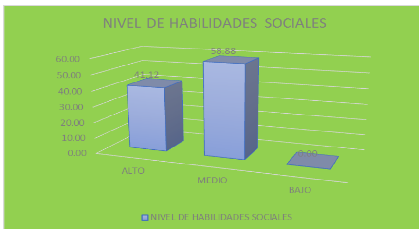
Figura 3 Nivel de habilidades Sociales de estudiantes de Enfermería UIGV

Al evaluar el nivel de habilidades sociales, el 58,88% de los estudiantes presentan un nivel medio y un 41,12% presenta un nivel alto.